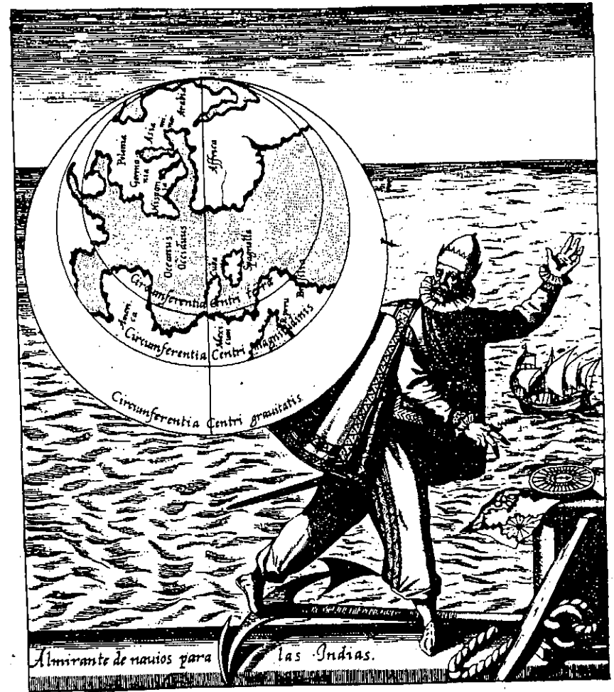
Fig. 2. Don Cristóbal Colón