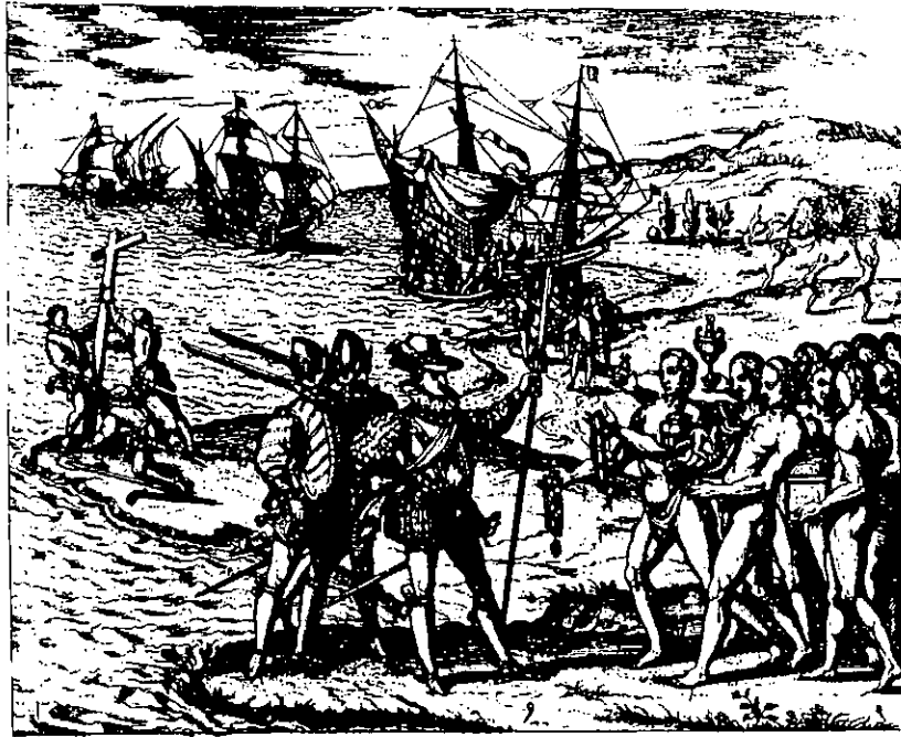
Fig. 3. Colón desembarca en Haití