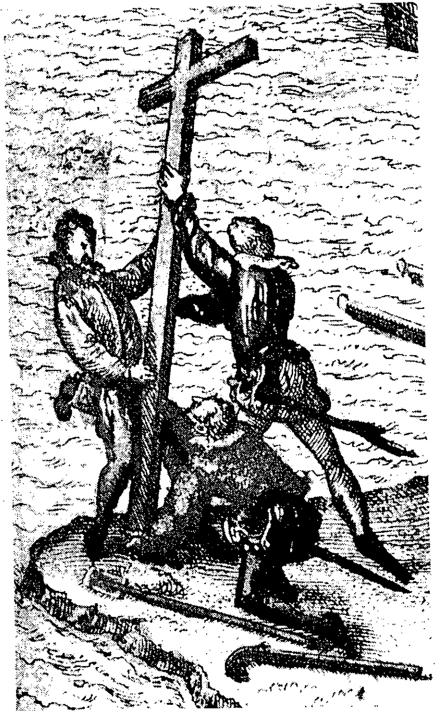
Fig. 4. Los españoles levantan la cruz en América