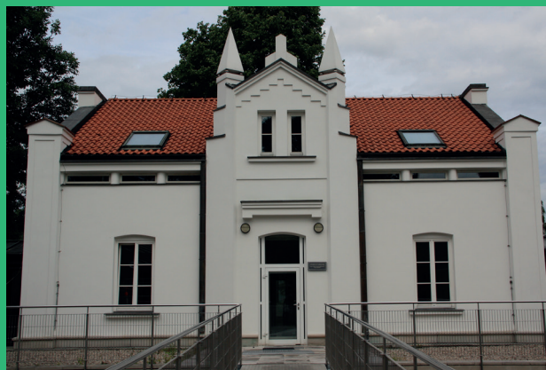
Biała Willa (ul. Dobra 72) 150 m od Biblioteki Uniwersyteckiej