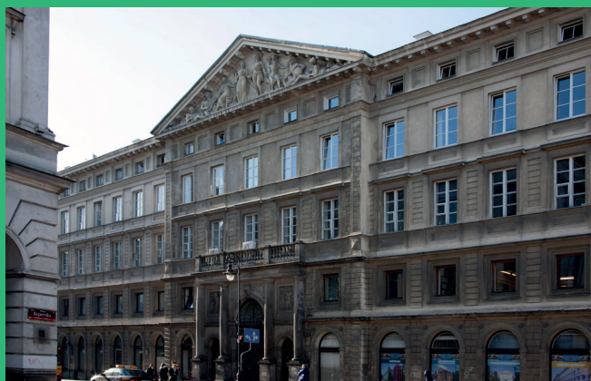
Pałac Zamoyskich (ul. Nowy Świat 69) 200 m od Kampusu Głównego UW